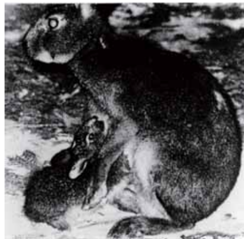
授乳中のニホンノウサギ。母ノウサギは深夜に短時間だけ授乳のために子のところに来ます。

本シリーズはこれで終わりますが、さらに興味をお持ちの方には、様々な哺乳類の繁殖について豊富な写真とともにやさしく解説している『和秀雄編(1999)どうぶつの妊娠・出産・子育て。メディカ出版(大阪)』をお薦めします。