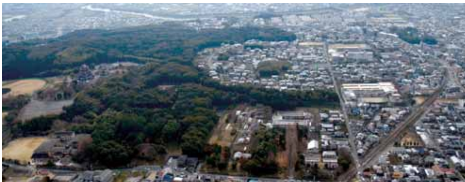
2008(平成20)年1月の関西支所。庁舎の東にこんもりと広がる実験林は、桓武天皇柏原陵・明治天皇伏見桃山陵の森に連なり、東山から続く尾根はまもなく宇治川北岸に裾を降ろす。