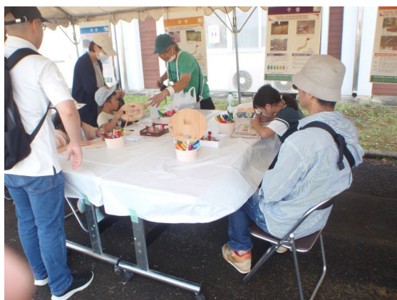
森林整備センターと森林保険センターによる 「丸うちわの絵付け」体験