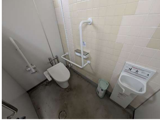
男女別トイレいずれにもベビ チェア有（対象：5ヶ月～2歳半 のひとりすわりができる子供）