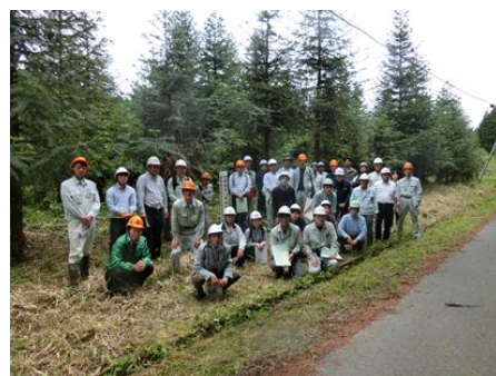
鳥取県中部森林組合のコウヨウザン植栽地にて