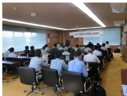
現地視察（鳥取県中部森林組合での概要説明）