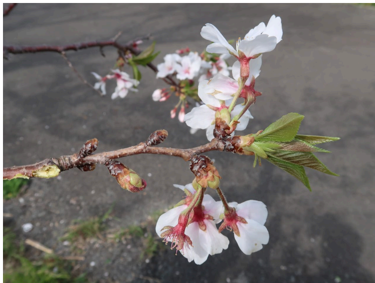
図 2 指宿市で見られた‘染井吉野’の開花異常の枝。開花した花芽および蕾の花芽に加え、まったく成長していない花芽が混在している。また、開花時に葉が展開している。2022 年 4 月 5 日 指宿市