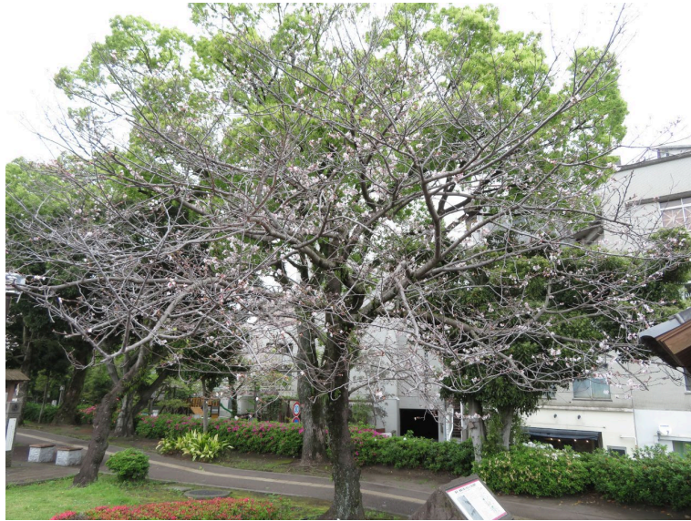
図3 鹿児島市で見られた‘染井吉野’の開花数が最大時の状態。開花期がバラついたことに加え、花芽が落下したことで、観賞価値が大きく損なわれている。2024年4月13日 鹿児島市