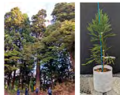
「千年杉」(左)と後継苗木(右)