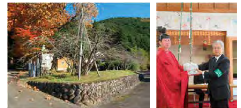
御形神社のショウフクジザクラ(左)と後継苗木の引き渡し(右)